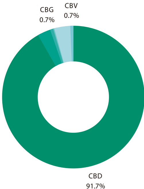
PERFIL DE CANNABINOIDES

Método Interno Basado en "DAB 2018 Cannabisblüten" (U-HPLC)